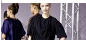
Yves Saint Laurent (62)