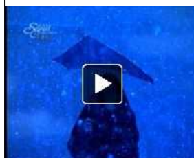
Défilé anniversaire de Wooyoungmi