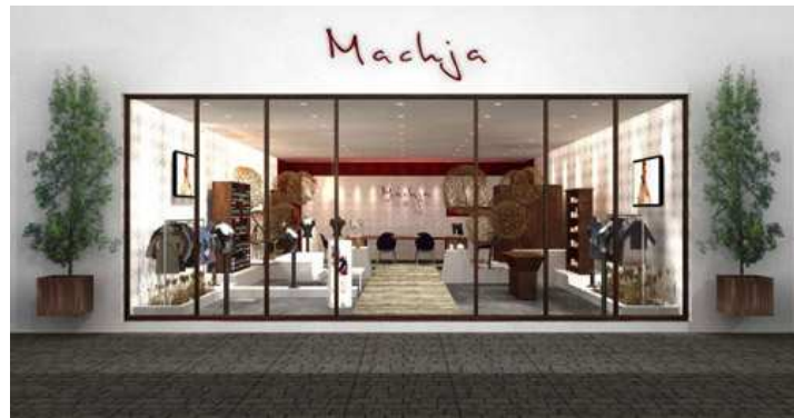
La boutique Machja à Marseille

C'est dans la cité phocéenne que la marque corse éco-lo Machja vient d'inaugurer son premier point de vente en propre. L'espace de 90 mètres carrés regroupe toutes les collections de la griffe.