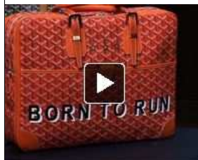
Vente aux enchères Goyard au profit de l'Institut Curie