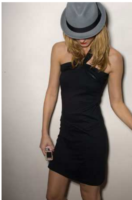
Robe en coton bio Machja